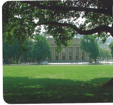
Schlossgarten, Großes Haus