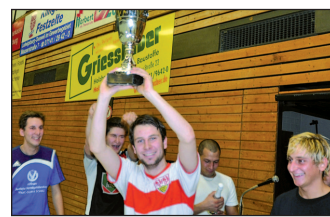
Beim letzten Spiel ging der Pokal an den FC Chelsea.

Am 20. Februar war es wieder so weit, die FSV-Oßweil-Fußball-Spieler der Abteilungen Aktive, Senioren sowie der A-Jugend trafen sich zum internen Hallenturnier in der Oßweiler Mehrzweckhalle. Der neue Spielmodus, bei dem sämtliche Spieler der teilnehmenden Abteilungen durch eine Auslosung den einzelnen Mannschaften zugeordnet wurden, kam bei allen Spielern gut an. So spielte der altegediente, erfahrenen Seniorenspieler zusammen mit ausgefuchsten Aktiven und spritzigen, wilden A-Ju-