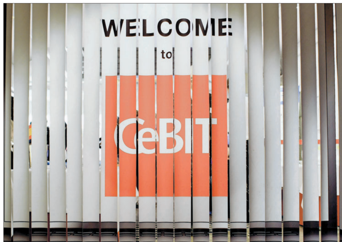
In Hamburg fand die Preview zur Cebit in Hannover statt.